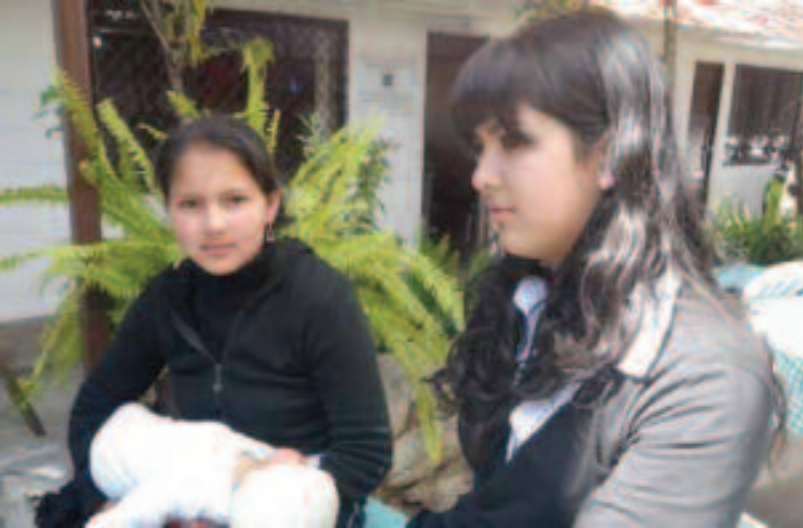
Madres adolescentes, usuarias de “Espacio Joven”

Las madres, en las entrevistas y grupos focales, resaltaron que se visualizan a sí mismas más empoderadas y manifestaron que están aplicando estas nuevas habilidades a sus vidas personales gracias a Espacio Joven.