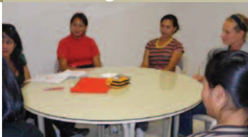
Participantes de las entrevistas y grupos focales

Para la investigación, se tomó como referencia a las usuarias de Espacio Joven y como grupo de comparación a usuarias de los servicios maternos de 2 clínicas en Cuenca que ofrecen servicios maternos con similares características que la Clínica Humanitaria. La investigación incluyó: entrevistas y grupos focales para obtener datos cualitativos y cuantitativos.