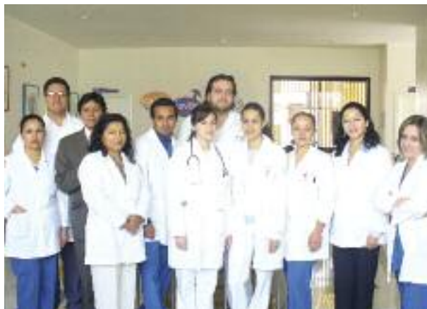
Personal de Espacio Joven