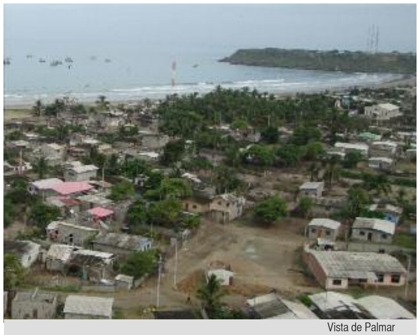
Vista de Palmar

Neo Juventud se conformó con el apoyo de la Iglesia Católica y CARE Ecuador. Desde el año 2003 al 2010, CARE contribuyó técnica y financieramente con el desarrollo de este grupo. Los programas fueron diseñados por los mismos jóvenes en base a sus necesidades y realidad local. Neo Juventud participó en diferentes proyectos de Salud