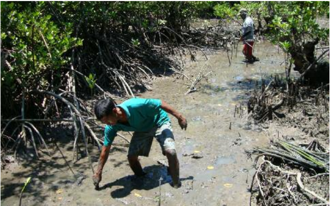
Reforestación del Manglar Palmar