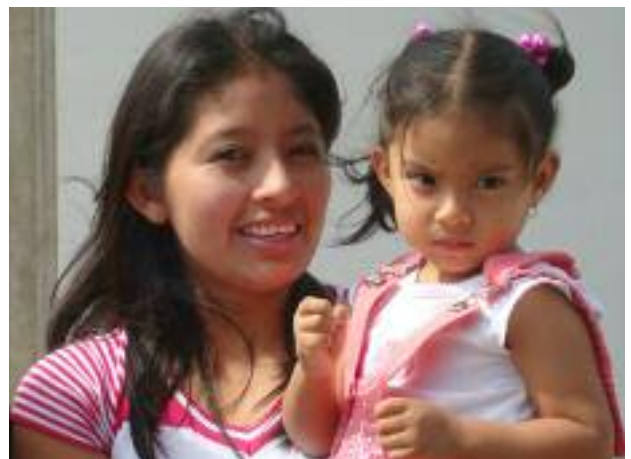
Trabajo de Neo Juventud con los niños y niñas de Palmar

En este contexto, también es importante involucrar a los hombres en el cambio de las normas de género que impiden el empoderamiento de las mujeres. En general existe la necesidad de ofrecer a los hombres jóvenes oportunidades de interactuar en sus comunidades con modelos de roles equitativos desde la perspectiva de género.