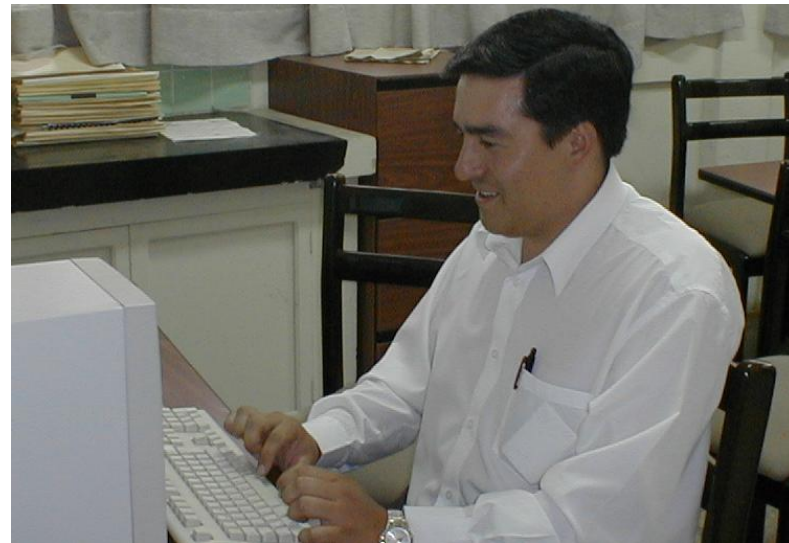
Aula de Residentes de Postgrado de Gineco-Obstetricia