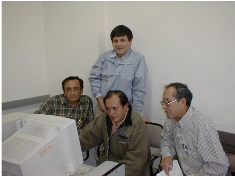
En el Centro Obstétrico